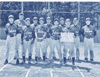
ソフトボール競技準優勝 いっしょうファルコン