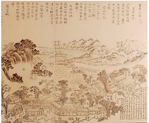
大浴場入り口を飾る「粟津八景」の陶壁画