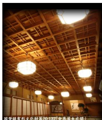
国登録有形文化財第20-137「金具屋大広間」