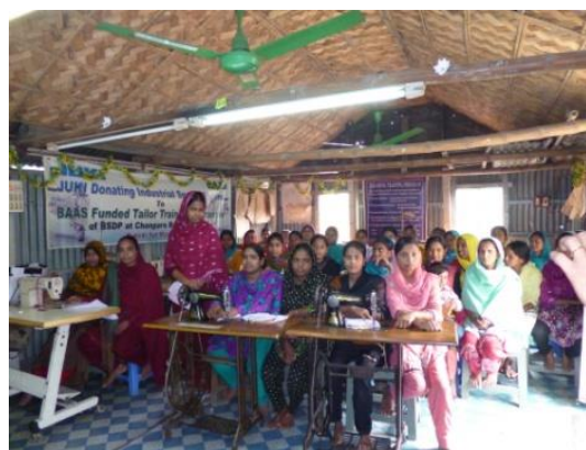
刺繍とミシンの訓練を受けている女性達。小学校に行けなかったり卒業できなかった女性が訓練を受けています。