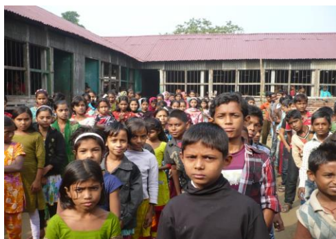
できた校舎の前で朝礼をしています。