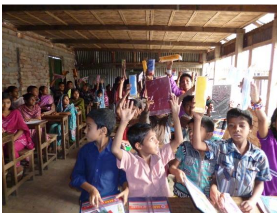
スポーツ大会で良い成績をあげ、賞をもって喜ぶ子ども達