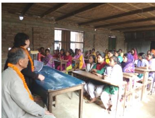
縫製訓練修了証授与式。2012年は90名の女性たちが訓練を修了できました。