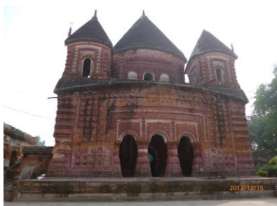
エク・バングラ寺院