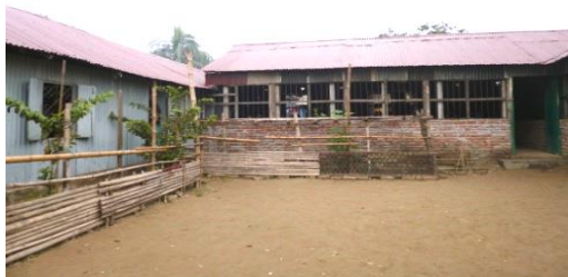
H24年に完成した第2、第3棟目の校舎（4教室分）