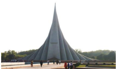
独立記念塔 (1971 年にパキスタンから独立)

Bangladesh にはイスラム教を中心にヒンズー教、仏教などあるが宗教間の対立はなく仲良くやっている。