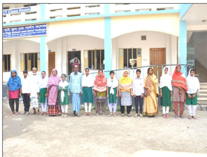
平成29年度里子と保護者達