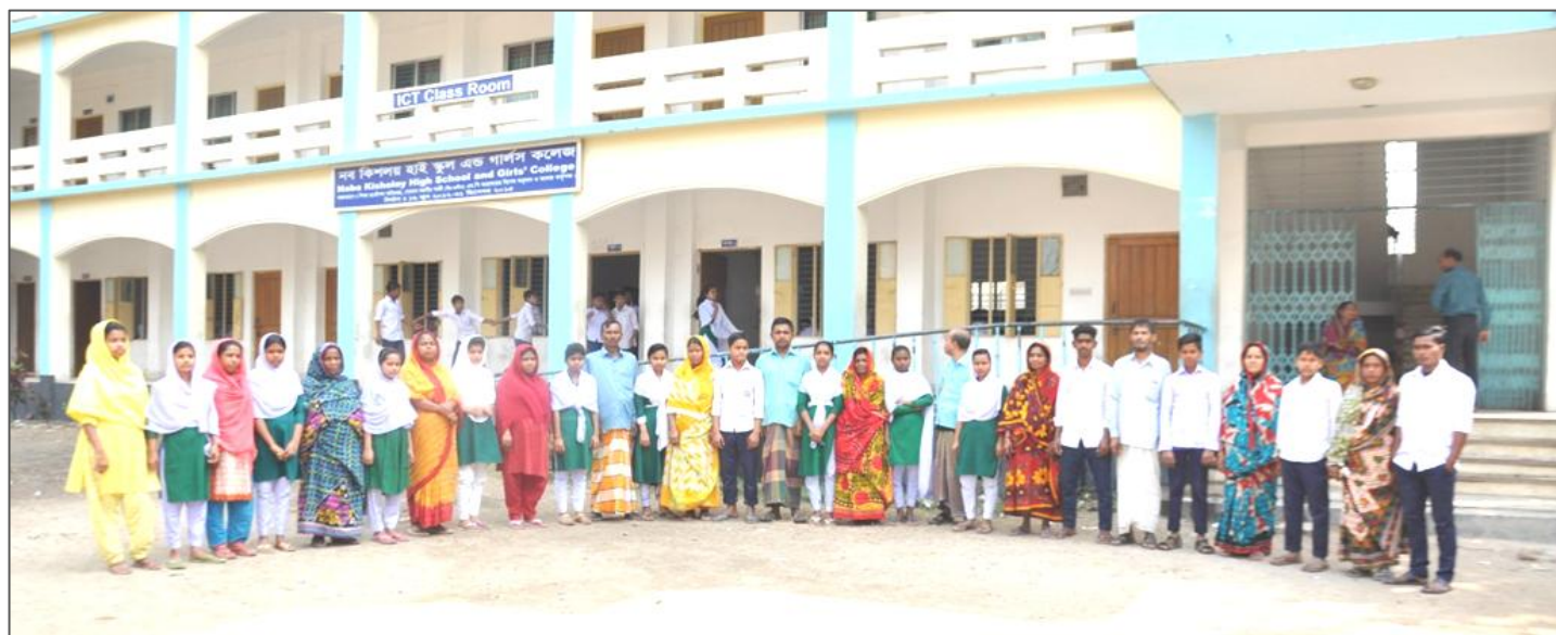
平成27年度の里子8名、28年度の里子6名と保護者達 里子達は全員厳しい進級テストに合格し、7年生と8年生になりました。