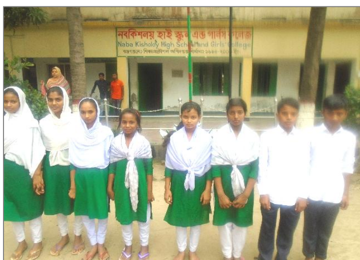
平成29年度の里子達8名

本年度新たな里子が8名加わり、平成27・28年度の里子達も無事進級し、総勢22名の里子達が、里親の支援を受けながら、元気に学校に通っています。医者、教師、銀行マン等、それぞれ、将来の夢をもち、勉強に励んでいます。