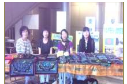
7 月女性連絡協議会による映画会