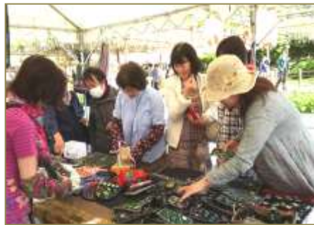
4 月・5 月藤祭り(曼陀羅寺)