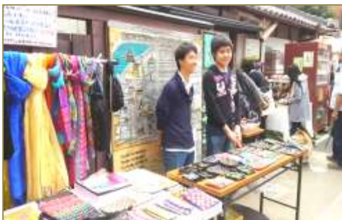
4 月犬山祭り (しみんてい)

本年度も皆様方には多大なるご理解ご協力をいただき、大変ありがとうございます。現地女性達によるノクシカタ刺繍の技術がさらに向上し、たくさんの民芸品が届きました。フェアトレードでより多く販売ができるようにと、出店場所や出店回数を増やして販売活動を頑張っています。