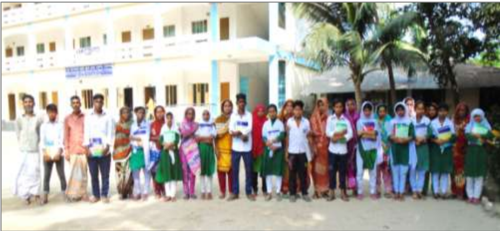
H27・28年度の14名の里子と保護者達