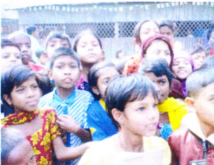
子どもたちの瞳はきらきら光っている。