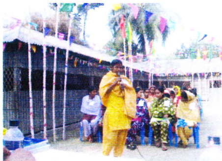
修了生の涙ながらのスピーチ