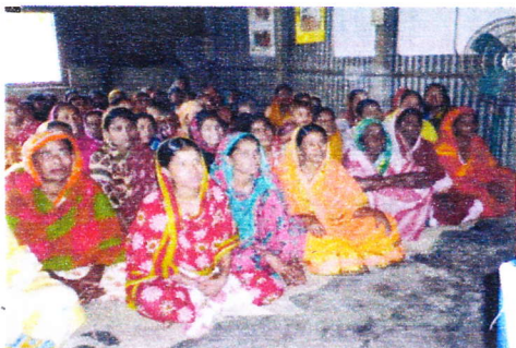
BSDPの会員の女性たちの集まり