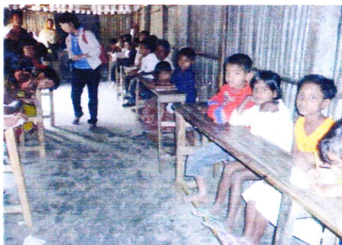
BSDP スクールの教室の中。ノート、鉛筆もない子が多い。教科書はもちろんない。はだしの子も多い。

280名が学んでいる。国の援助が受けられないため、N G Oの学校でぎりぎりのところで行っている。最低の教育環境である。しかも現実にはきびしく年々学年が進むにつれて就学数は減少している。少しでも大きくなれば、家庭の働き手となり学校に来られなくなるのが実情だそう。同じ学年の中でも年の差にちがいはあるのはそういった家庭の事情があるからなのだろう。