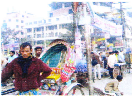
力車、人、車で込み合うバン格拉デシュ

3日目 いよいよ私たちの目的であるスラム街にある学校へ出かけた。車の中から町の様子を見ることができた。町の中は人・人・人でごったがえし、日本では廃車とされるようなボコボコの