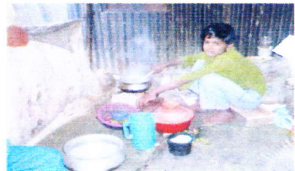
学校に行かないで料理をしたり、妹や弟の面倒を見ている。