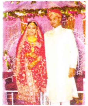
バングラデシュの花嫁・花婿

日本とはあまりにもちがいすぎる国を肌で感じた。安穏な生活の中においては得ることのできない貴重な体験であった。女性の自立支援をすることがその子供の教育を支えることだと考え、少しであるが遠い国から出来るだけの協力をしたい。