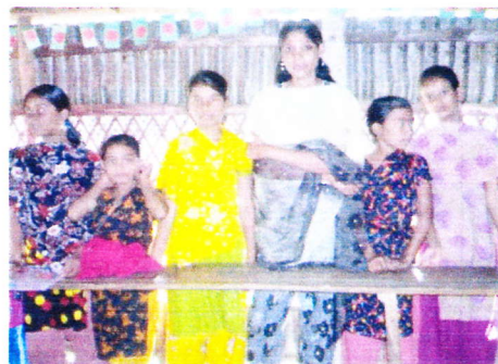
同じ学年でも、年齢の高い子も交じって勉強している。