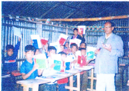
BESSの支援金で、ノートや教科書などの文具が子どもたちに与えられた。