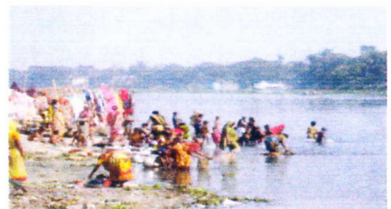
近くの川は大切な生活の場。沐浴したり洗濯をしたりする。