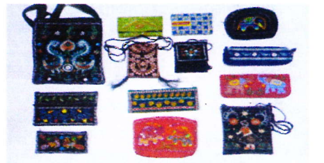
バングラデシュの民芸品「ノクシカタ」