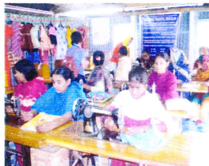
小学校を卒業できなかった女子たちなど、ミシンの技術の訓練を受けている。