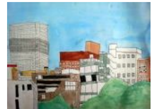
6年・屋上からの風景