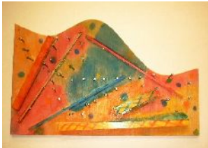
3年・木と釘と色のハーモニー