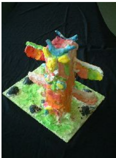
3年・トーテムポールの ある風景