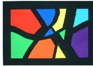
5年・分割の美しさをつくろう