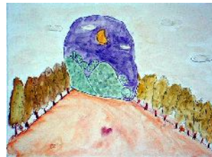
5年・不思議な世界