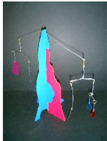
4年・ゆれるモビール