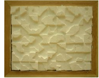
6年・凹凸の美しさをつくろう