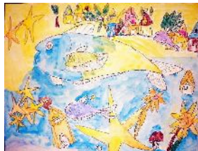
4年・思いを重ねて