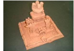
6年・私が発掘した 古代の遺跡