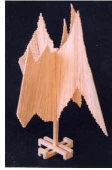
5年・空間をつかもう