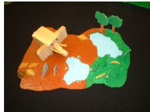
4年・木々動物ランド