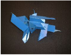
3年・モニュメントをつくろう