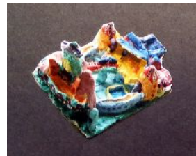
5年・こんな建物があれば