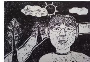
6年・自画像と心象風景