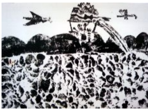
3年・帽子に乗って空を行けば