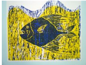
4年・彫りを重ねて