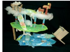
5年・空間に生まれた私の世界