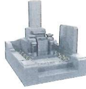
3.0 聖地<和墓> 1,970,000円～