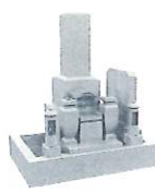
1.5 聖地<和墓> 1,100,000円～