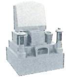
1.0 聖地<洋墓> 1,250,000円～