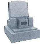
1.0 聖地<洋墓> 900,000円～