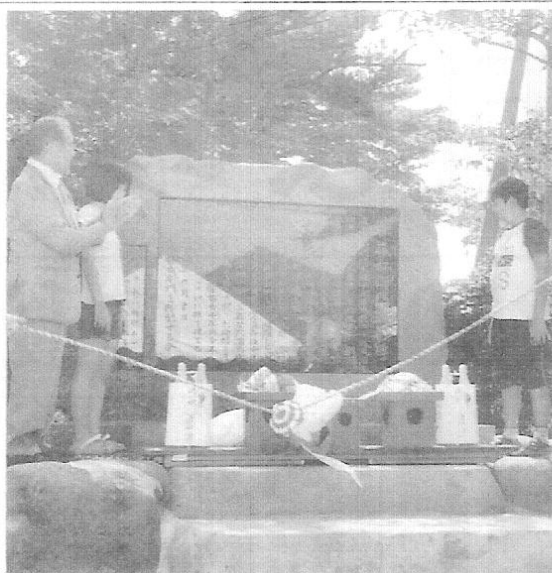
披露された森藤右衛門の顕彰碑 (酒田市の横道町児童公園で)

明治初期に庄内地方で起 亀ヶ崎の横道町児童公園にきた農民運動「ワッパ騒動」の指導者で、酒田市出身の自由民権運動家・森藤右衛門（1842～85年）の功績を伝える顕彰碑が、同市 右衛門を顕彰する会」同公園は、森が当時、農民が苦しんでいた納税方法の改革を訴えに何度も訪れた旧酒田県庁の跡地で、森の命日である9月16日に合わせて披露された。