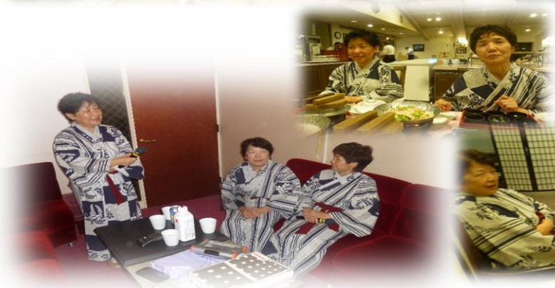
カラオケのひととき