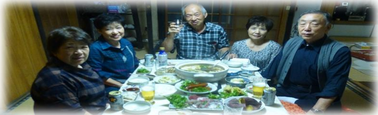
3度目の訪問 鍋を囲む