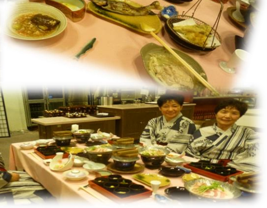
美味しくいただきました！