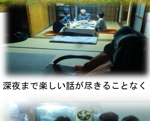
深夜まで楽しい話が尽きることなく