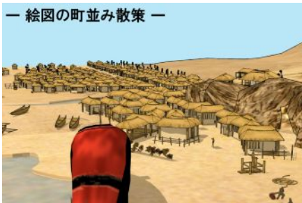
一 絵図の町並み散策 一

江戸中期、内藤家時代に描かれた絵図（磐城七浜捕鯨絵巻（小名浜の図））をもとにして、漁村、小名浜（福島県いわき市）が甦る。三崎には、海上を取り締まる番所が見え、米野村には、米蔵が見える。代官所とお寺の浄光院が見える。ここは、鯨が獲れ、塩釜のある砂浜だった。2006年新築された浄光院（日本建築）の映像付。建築の美しさ、骨組みのアニメーションは見どころです。