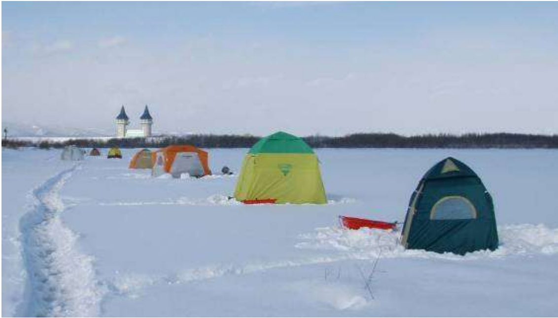
石狩川方向を望む