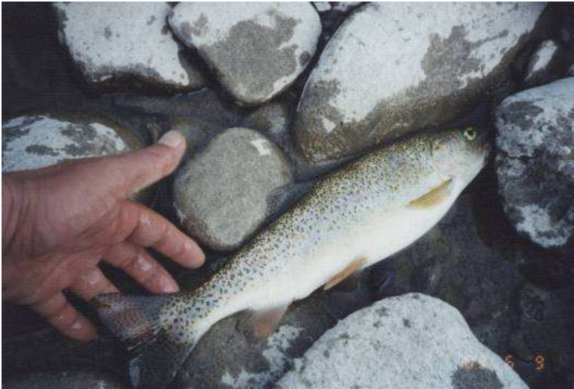
芦別川のニジマス 6月9日