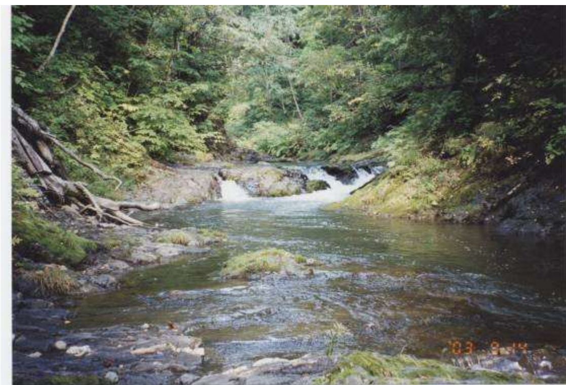
パンケ幌内川の流れ