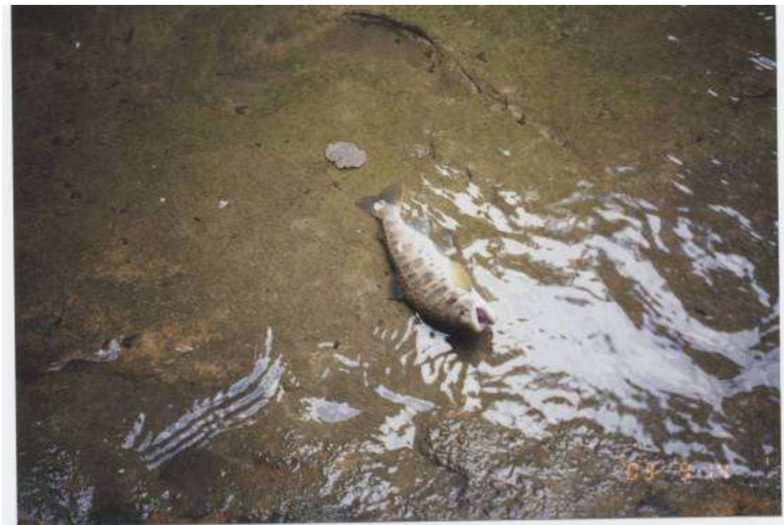
パンケ幌内川のヤマメ 9月14日