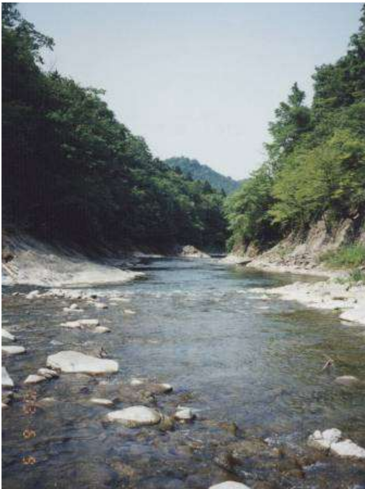
芦別川の流れ 6月9日