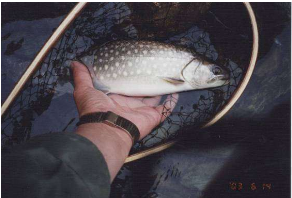
内大部川のアメマス 6月14日