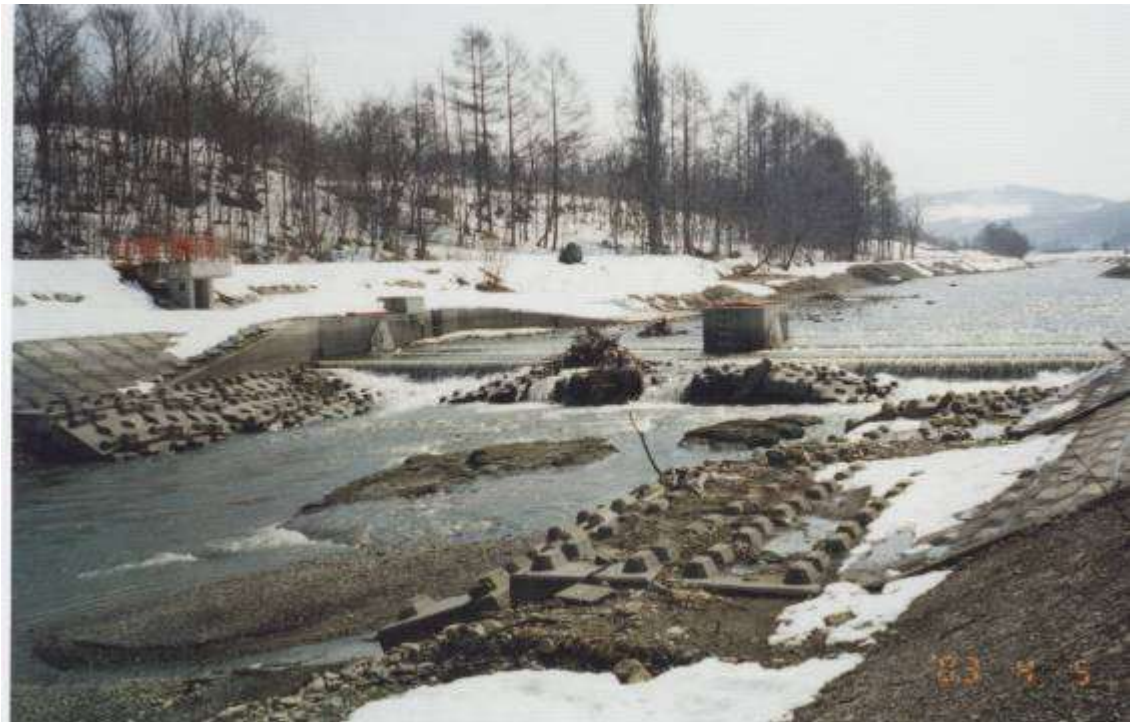
早春の内大部川 4月5日