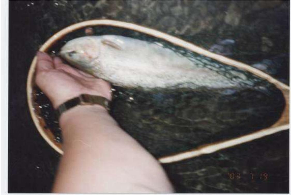
内大部川のニジマス 7月19日