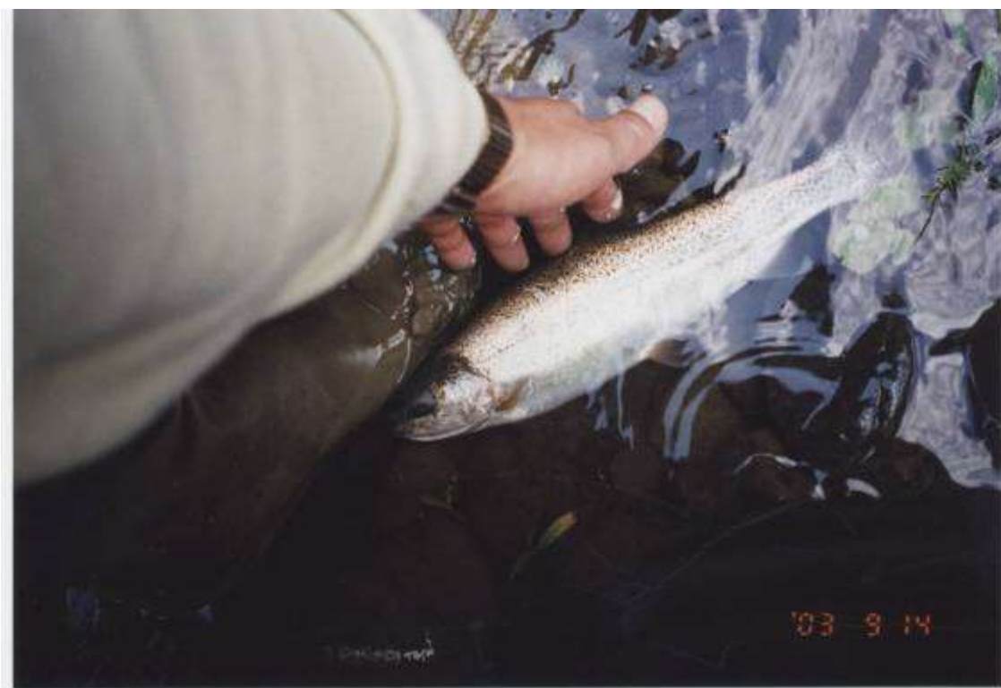
パンケ幌内川のニジマス 9月14日