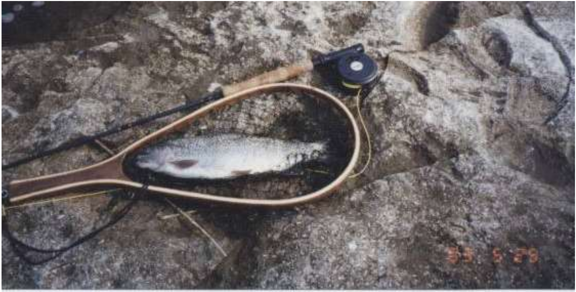
内大部川のニジマス 5月25日