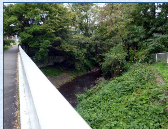
稲荷橋 上は八王子バイパス