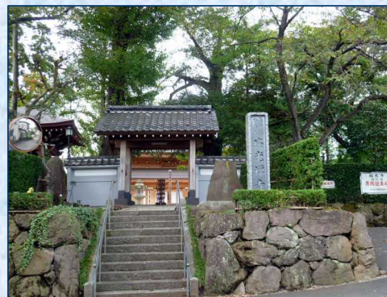
瑞光寺 狭い道の奥に立派な本堂が・・・