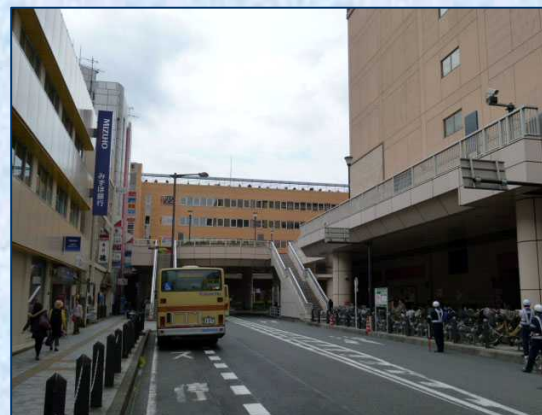
橋本駅北口を出発 10/30 10:05 こんな所でも取り締まりをやっているよ。