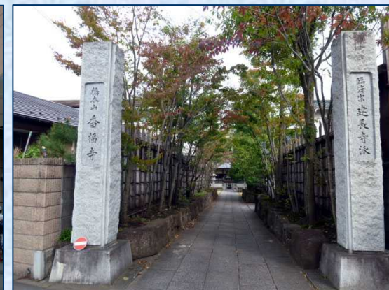
香福寺 ここから入り、素晴らしい境内を左に出ると近道になるのだが・・・。