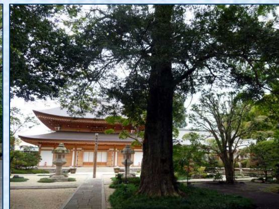
瑞光寺のカヤの大木、三人位で囲めるかも。