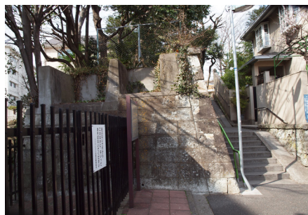
No. 98 三田用水白金台築樋遺構