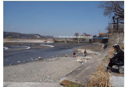
No. 6 羽村の堰