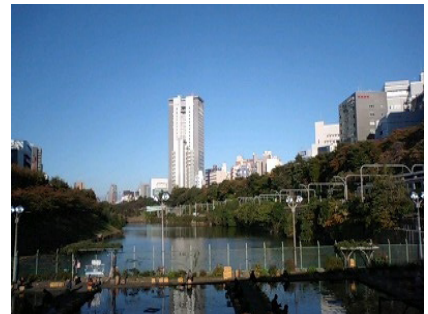
No. 37 市ヶ谷濠・新見附濠・牛込濠