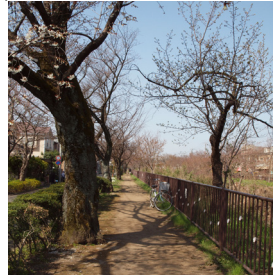
No. 16 名勝小金井桜