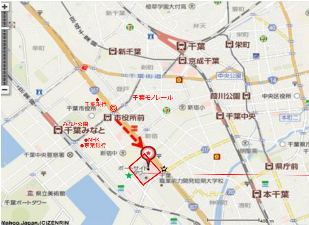
千葉ポートスクエア 施設配置図