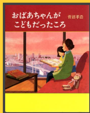
『おばあちゃんがこどもだったころ』 (菅沼孝浩/著 岩崎書店 2017.4)

大阪府立中央図書館 国際児童文学館 近鉄けいはんな線 荒本駅下車 (1号出口) 北西へ約400M HP : http://www.library.pref.osaka.jp/site/jibunkan