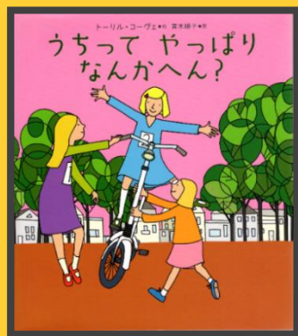
『うちってやっぱりなんかへん?』 (トーリル・コーヴェ/作 青木順子/訳 偕成社 2017.2)