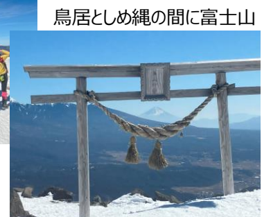
鳥居としめ縄の間に富士山