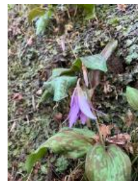
飯盛山のカタクリの花