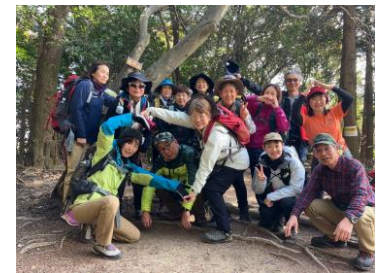
海上の森物見山にて