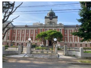
名古屋市市政資料館

名古屋市役所本庁舎は、三代目庁舎で昭和8年に竣工したものです。和風の瓦屋根を載せた「日本趣味を基調とした近代式」で中央にそびえる時計塔に特徴があります。