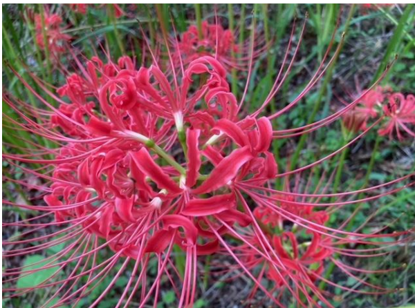
彼岸花【大高緑地公園】 2024.9.27 撮影

さて、10月号をお届けします。朝ドラ「虎に翼」をご覧になられた方もいらっしゃるかと思いますが、我々社労士も法律のもとに労働・雇用・社会保険に関してみなさまに少しでもお役に立ちたいと活動しています。どうぞお役立てください。