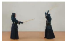
②十分に振りかぶる。