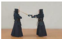
⑥十分に振りかぶり、斜め右頭上より振り下ろし左面を打つ。