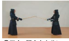
⑦双方、間合を十分にとる。