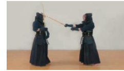
④十分に振りかぶり、斜め左頭上より振り下ろし右面を打つ。