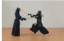
③直ちに大きく振りかぶり正面を打つ。