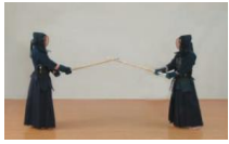
⑦双方、間合を十分にとる。