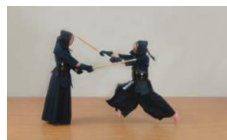
③直ちに大きく振りかぶり正面を打つ。