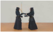
①体勢を崩さないように腰を中心に進出し、相手と正対する。