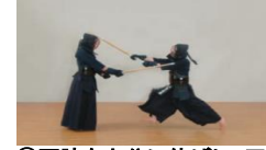
⑨両腕を十分に伸ばし、正面を打つ。