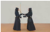
①体勢を崩さないように腰を中心に前進し、相手と正対する。