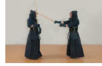
④十分に振りかぶり、斜め左頭上より振り下ろし右面を打つ。