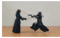
⑨両腕を十分に伸ばし、正面を打つ。