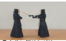
⑥十分に振りかぶり、斜め右頭上より振り下ろし左面を打つ。