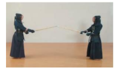
⑤双方、遠い間合で中段に構える。