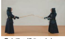
⑧中段の構えのまま、一足一刃の間合に入る。