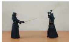
②十分に振りかぶる。