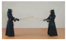
⑧中段の構えのまま、一足一刀の間合に入る。