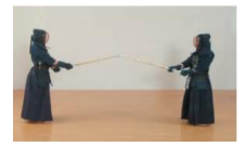
⑤双方、遠い間合で中段に構える。