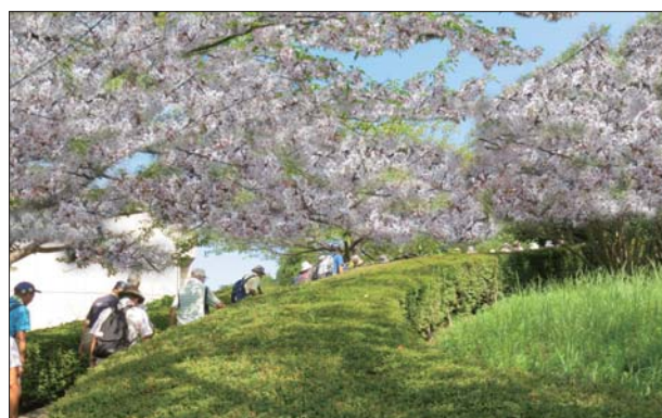
(ふるさと尾根道緑道・イメージ)