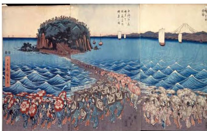
歌川広重《相州江之嶋弁才天開帳参詣群集之図》