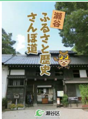
瀬谷ふるさと歴史さんぽ道 ガイドマップ