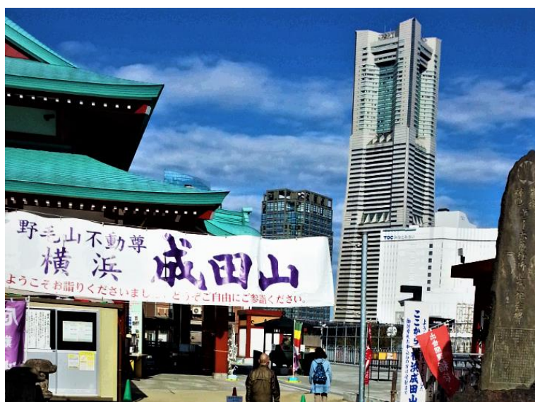
【成田山横浜別院延命院】