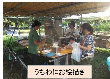
うちわにお絵描き