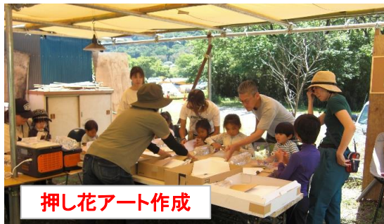
押し花アート作成

今年度も子供の日に「押し花アート」「ミニ薪プレゼント」「ヒマワリ種まき体験」等のイベントを実施したヒマワリ種まきは、今後「自分で蒔いた種から芽が出て育ち花が咲く過程の観察を楽しめる」と大好評でした。