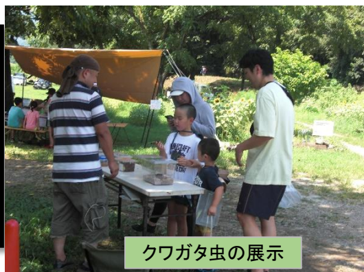
クワガタ虫の展示