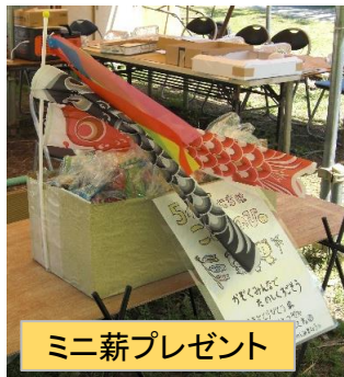
ミニ薪プレゼント