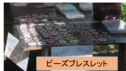
ビーズブレスレット