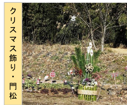
クリスマス飾り・門松

花壇の整備を進めて色々な草花を植えました、菜の花・チューリップ・ザル菊・ビオラ、パンジー類・ランタナ等々ひまわりも色々な種類の花(黄色・レモンイエロー・赤)を咲かせました。