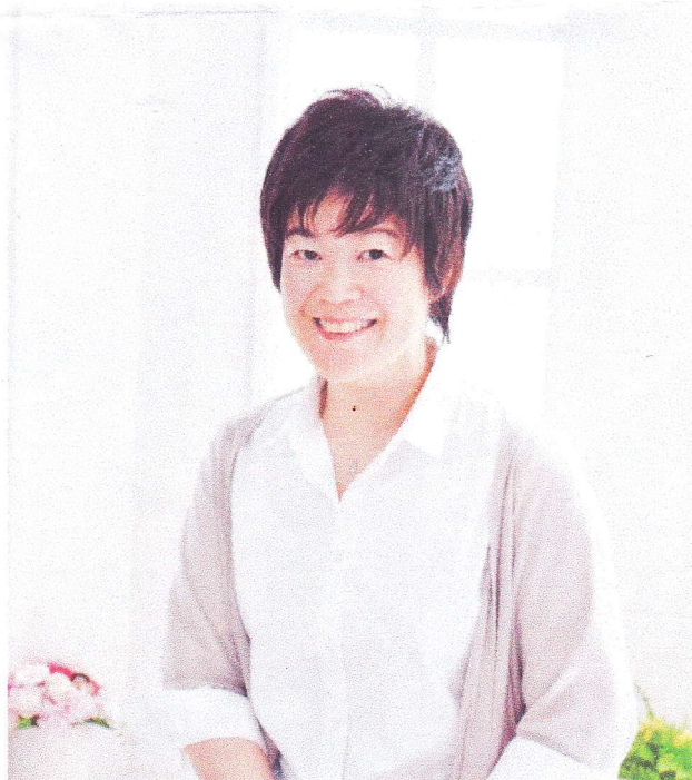
全日本柔道連盟科学研究部員

シドニーオリンピック金メダリスト井上康生氏の兄 2001年アジア柔道選手権大会 優勝 その他多数実績あり