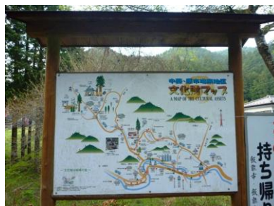
↑ 下が正解の文化財MAP 出題写真とよく比較して下さい