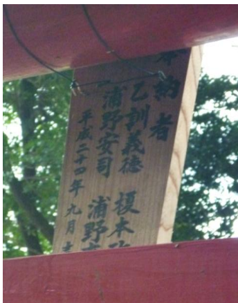
↑当初の正解だった平成24年の掲示 (右の写真の赤い鳥居の扁額の裏)