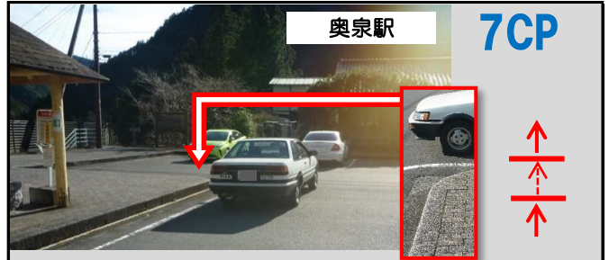
20図 バス停先の縁石の角 再スタートはロータリー出口の停止線(左の写真参照)