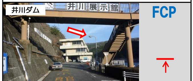
28図 歩道橋そばにある写真の外灯 計測後はこの先の駐車場へ移動