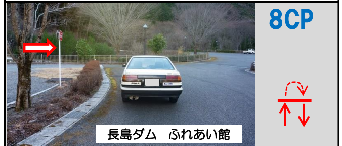
23図 駐車場導入路の消火栓標識 再スタートは折り返して同じ位置から