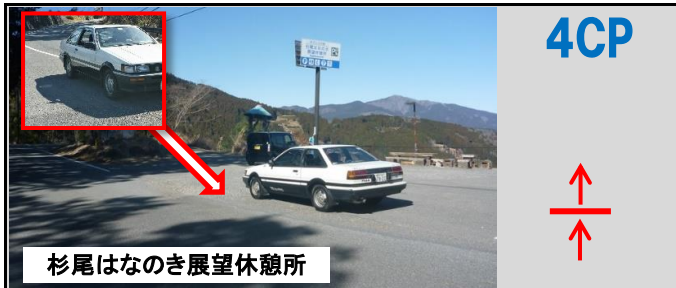
杉尾はなのき展望休憩所

12図先 右手施設敷地内の舗装の切れ目 (駐車車両により写真位置に寄せられない場合は、後続車に気を付けて道路上で計測)