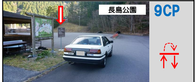
25図 案内図横のおねがい看板 再スタートは折り返して同じ位置から