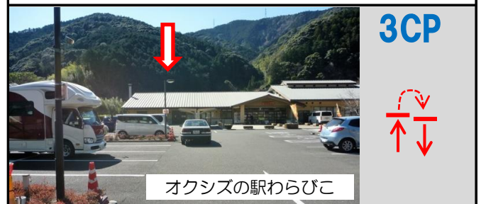
オクシズの駅わらびこ

10図 駐車場内の写真の外灯 再スタートは折り返して駐車場出口の停止線(左の写真参照)