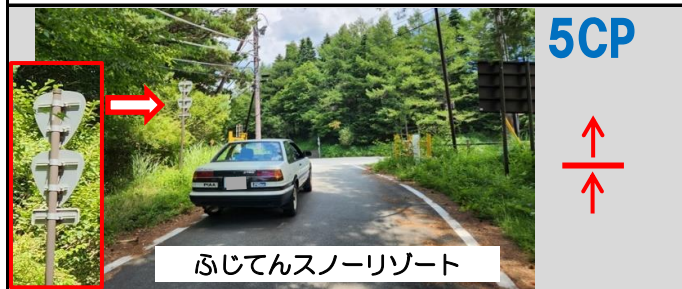
15図先 写真の注意標識(裏向き)