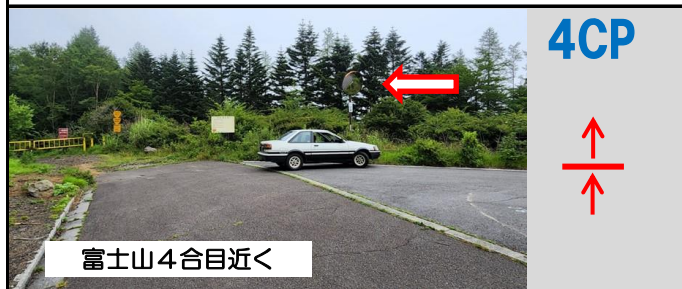
13図先 大きな右コーナー途中の左手の カーブミラー (CP位置の関係でこのコーナーは外側いっぱいを走行)