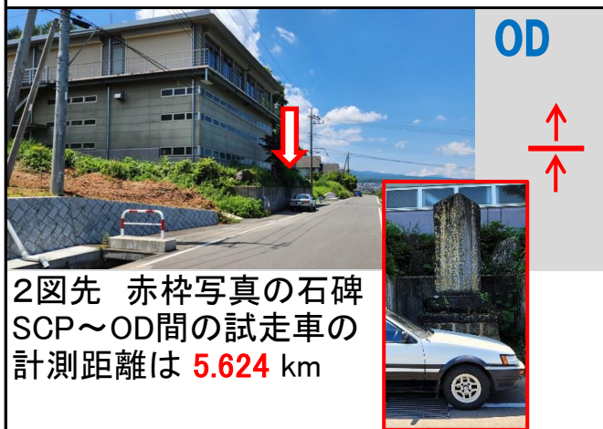
2図先 赤枠写真の石碑 SCP~OD間の試走車の 計測距離は 5.624 km