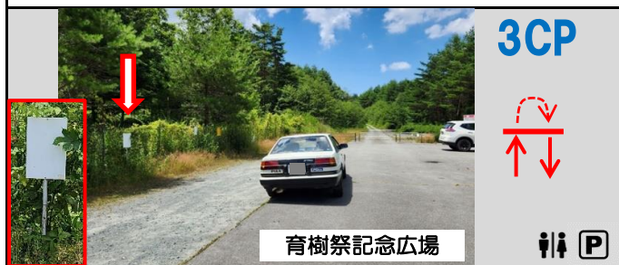
11図 左手の(文字が消えた)白い看板 折り返して同じ位置から再スタート