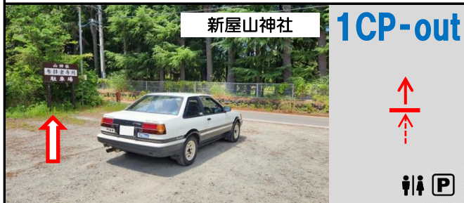
6図 「山神社参拝者専用駐車場」看板の 手前側支柱

(注)「向こう端」など具体的な指定がない場合は、目標物の中央部で計測 (注)ラリークラスのQ-A(距離計測)は、CP間距離を0.01km単位で解答 ドライブクラスのQ-A(距離計測)は、SAQR方式(距離の短い順を解答)