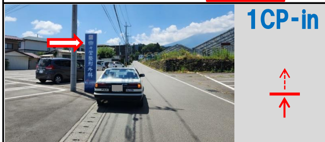
4図からすぐ「楽々堂整形外科」看板 新屋山神社へのルートは5図参照