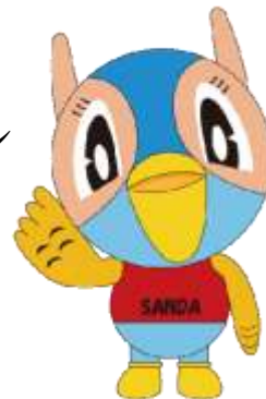
三田市マスコットキャラクター 『キッピー』