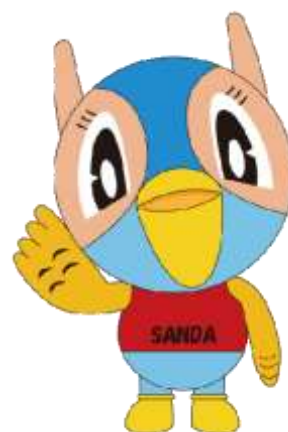
三田市マスコットキャラクター 『キッピー』