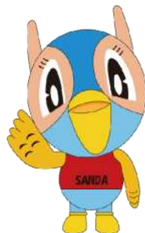
三田市マスコットキャラクター 『キッピー』