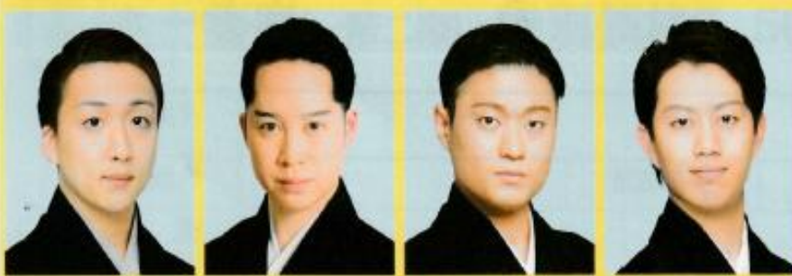
中村 米吉 中村 虎之介 中村 福之助 中村 壱太郎

本年も若手実力派花形役者による「三月花形歌舞伎」を歌舞伎発祥の地・京都にございます南座にて開催決定！！ 皆様お誘いあわせのうえ、ご観劇にお越し下さいませ！