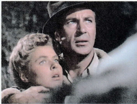
「誰が為に鐘は鳴る」