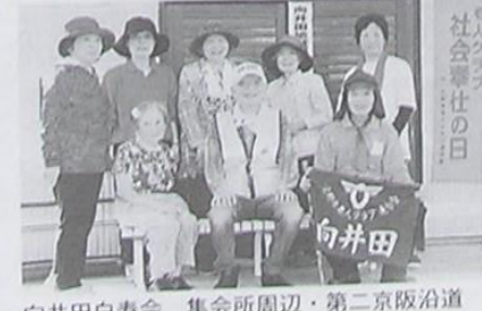
向井田白寿会 集会所周辺・第二京阪治道