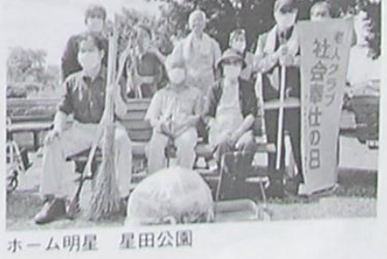
ホーム明星 星田公園