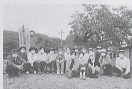
私市笑和会 私市共同墓地