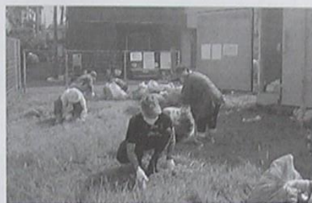
駅前住宅はつらつ会 駅前住宅第3公園