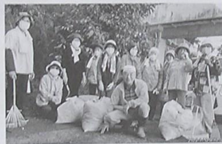
私部長寿会 私部会館周辺