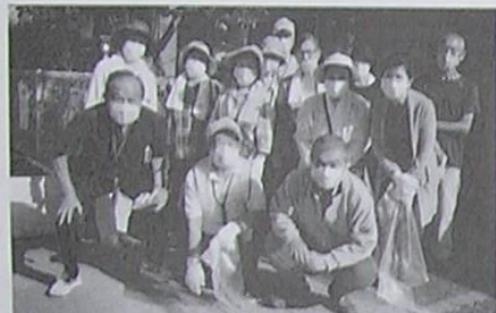
梅が枝シニアクラブ 団地内