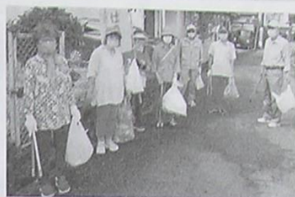
榎野星友クラブ 町内公道周辺