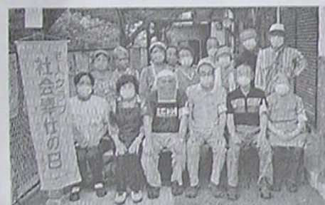
私市山手さわやかクラブ 自治会館