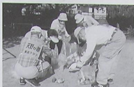
天野が原町星友クラブ 町内と公園