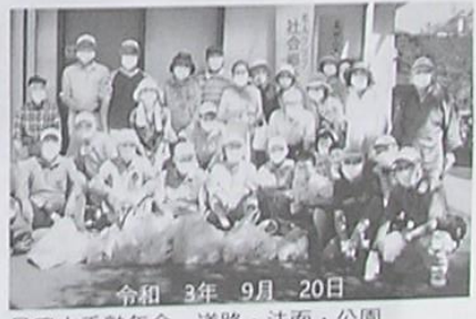
令和3年9月20日 星田山手熟年會 道路・法面・公園