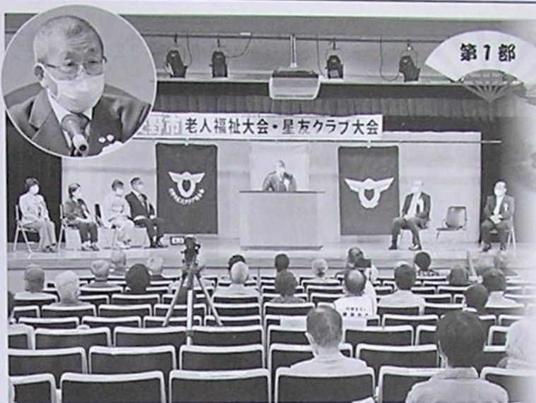
交野市老人福祉大会・星友クラブ大会

交野市老人福祉大会・交野市星友クラブ大会が令和3年10月2日(出) ゆうゆうセンター交流ホールで開催されました。感染症予防として、参加人数の制限、検温、手指の消毒、室内の換気、座席の間隔を空けるなど対策を徹底。会場にはマスクを着用した230人が参集しました。