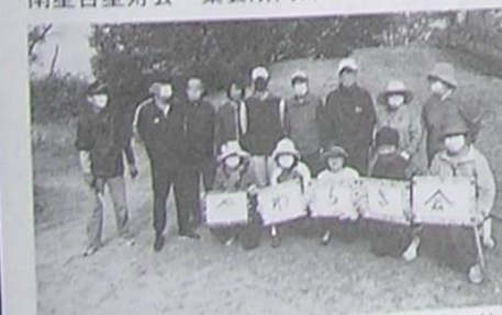
妙見東やわらぎ会 中央公園・地区入口他