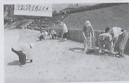
星田西遊友クラブ 南公園内