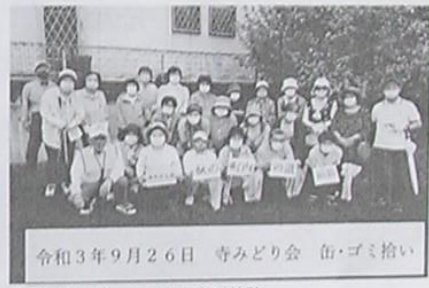
令和3年9月26日 寺みどり会 街・ゴミ拾い 寺みどり会 寺地区の道路