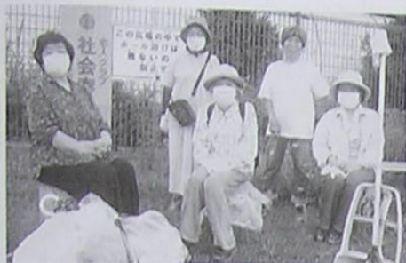
青山長寿会 府道・国道周辺