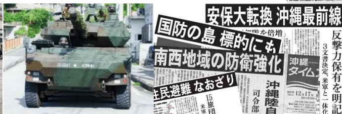
▲与那国島内を走る陸自戦闘車(11/18 八重山毎日)