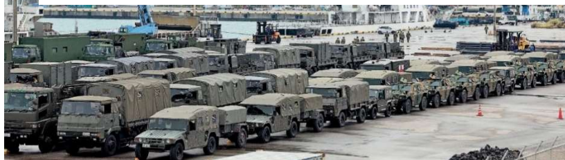
▲中城湾港に上陸した自衛隊車両(11/9 琉球新報)

戦場化が迫る琉球弧、その戦争計画と密接に連動した横浜港の米軍新部隊配備！武力で平和はつukれない！