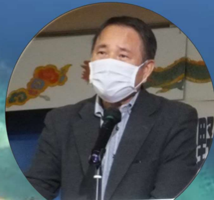
▲2021年12/13 鶴見沖縄県人会館にて