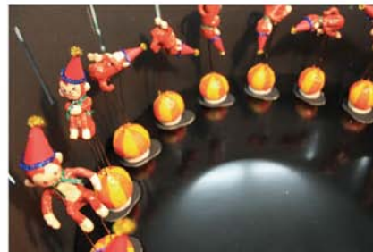
なにがみえるかな？ / 広瀬美純 切り込みから中をのぞいてまわしてみると…。