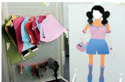
きせかえ人形 / 魏棋 お気に入りの服に着替えて、 いつもの自分から変身してみよう。