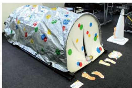
きづきほらあな / 中村めぐみ+高橋侑子+平谷佳世 全身で感じながら「ほらあな」でなごもう。