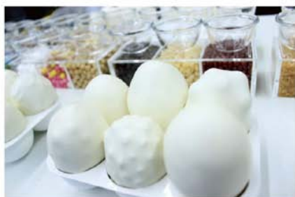
なんのたまご？ / 大泉義一 見た目は「卵」。 触ってみるとあれ？何の卵かな？