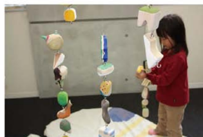
つなげるモビール / 岡瑤子 バランスをとりながら、 自分の好きなモビールどうしをつなげてみよう。