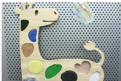
さわる さわる / 山下真菜 いろいろな触りごち。お気に入りは何？