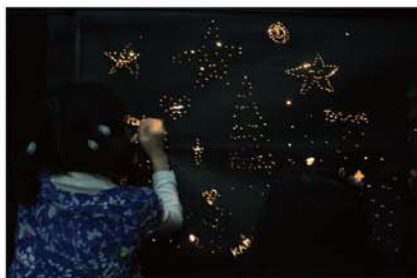
光の点でえがこう / 岩崎知美 暗闇に黒い紙。穴をあけてみるとそこから光が…