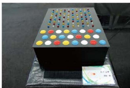
スイッチ / 原田萌 思う存分、スイッチを入れるのって楽しい！ …何が起こるかな？