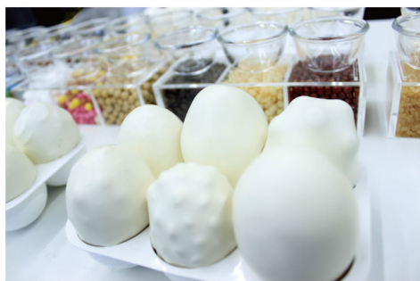
なんのたまご？ / 大泉義一 見た目は「卵」。 触ってみるとあれ？何の卵かな？