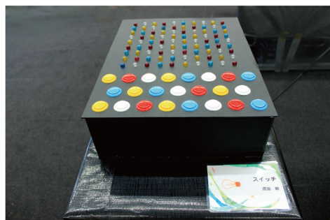
スイッチ / 原田萌 思う存分、スイッチを入れるのって楽しい！ …何が起ころかな？