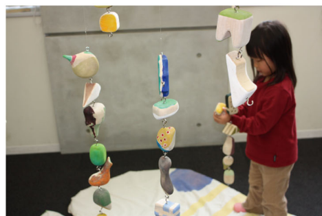
つなげるモビール / 岡瑤子 バランスをとりながら、 自分の好きなモビールどうしをつなげてみよう。