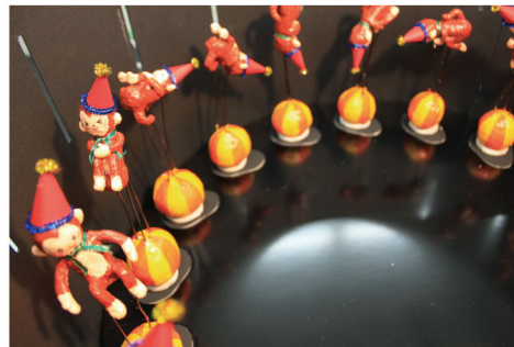
なにがみえるかな？ / 広瀬美純 切り込みから中をのぞいてまわしてみると…。