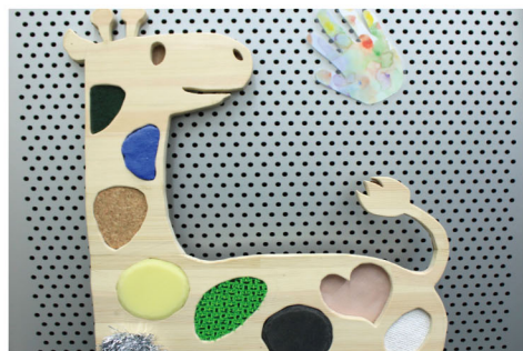
さわる さわる / 山下真菜 いろいろな触りごち。お気に入りは何？