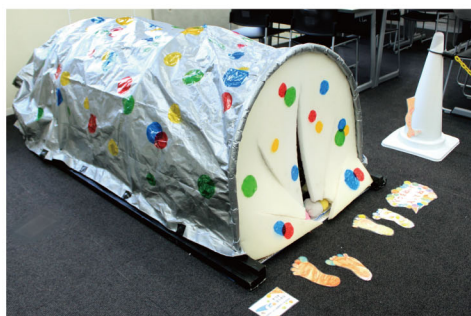
きづきほらあな / 中村めぐみ+高橋侑子+平谷佳世 全身で感じながら「ほらあな」でなごもう。