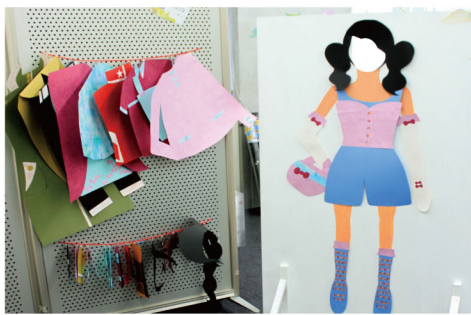
きせかえ人形 / 魏棋 お気に入りの服に着替えて、 いつもの自分から変身してみよう。