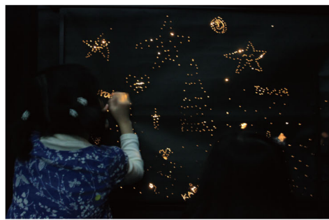
光の点でえがこう / 岩崎知美 暗闇に黒い紙。穴をあけてみるとそこから光が…