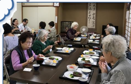
2018年の昼食会の様子