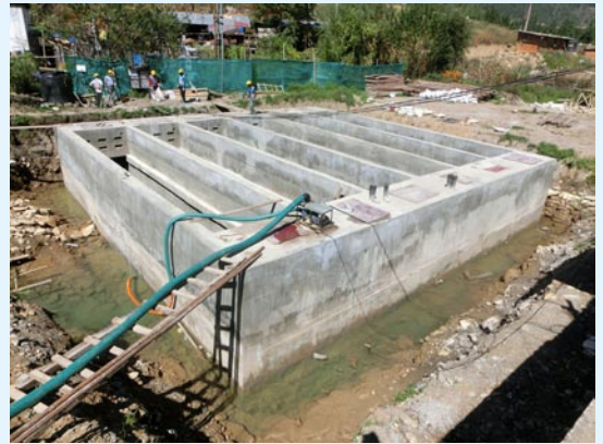
ブータンの工事現場

下記のような内容で、「土壌浄化法ブータンセミナーツアー」を企画しています。ブータンでは期待されるセミナーになるようですから、是非ブータンにお出かけ下さい。