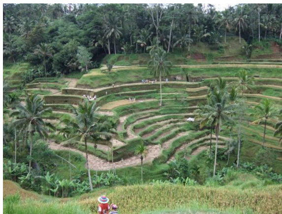
テガラランの棚田

五月二七日(水)から六月一日(月)まで、インドネシアのバリ島、ジャワ島を旅行してきました。バリ島は最後の楽園と言われる女性に人気のリゾート地、ジャワ島中部のジョグジャカルタは二つの世界遺産があり、単なる観光旅行といえはそれまでなのですが、