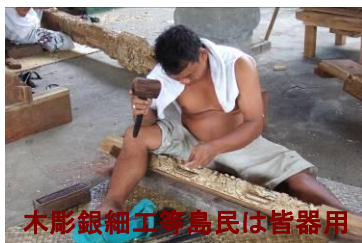
木彫銀細工等島民は皆器用

棚田の水配分を共同して円滑に行うためにスバクという強力な農民組織があり、田んぼの傍、村内、広域圏といたるところに