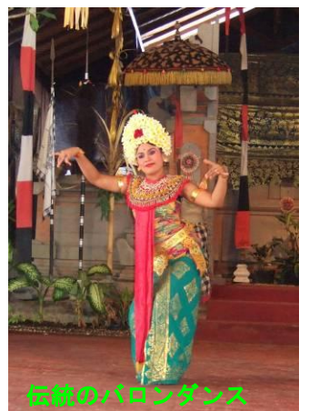
伝統のバロンダンス

8世紀頃といえば、平安遷都したところで既に日本にも仏教が入ってきており、タイや中国など世界中からポロブドールへ仏教巡礼者が集まっていた。しかも、日本と同じ大乘仏教とのことで親しみやすい。資料では現在インドネシア