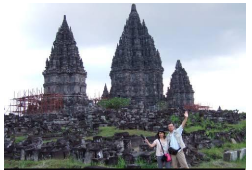
世界遺産プランバナン寺院は地震崩壊で修復中、ライトアップを背景にラマナバレ