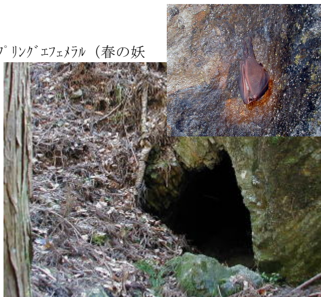
林間の洞窟にはコウモリ