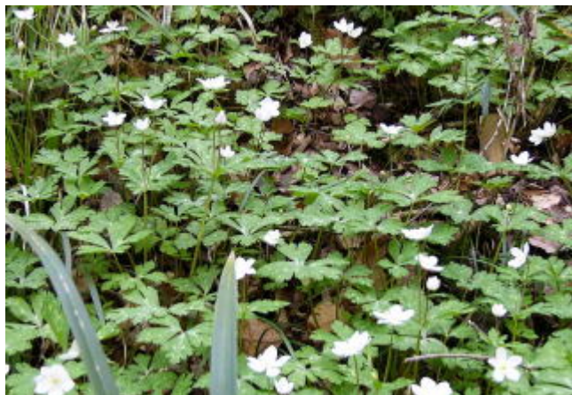
ニリンソウの群落が満開

昼食後は近くの洞窟探検 コウモリが就寝中でした。周辺には春の山野草スプリングエフェラル（春の妖精）カクリ、イゲ、ニリンソウなどが満開です。小春日和の中観察会を満喫しました。