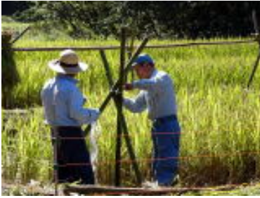
立派に実った古代米