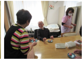
* 手作りの練り切り