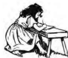
「Heidi」より W.Smith 画