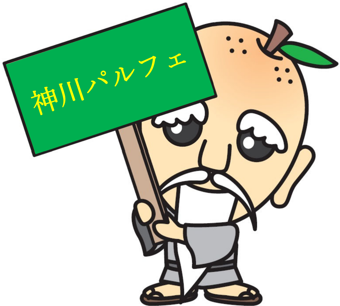
神川町マスコット神じい