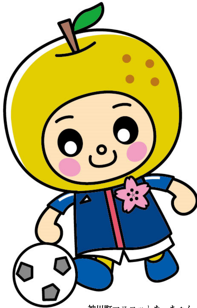
神川町マスコットなっちゃん