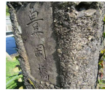
親柱の橋名は「豊岡橋」