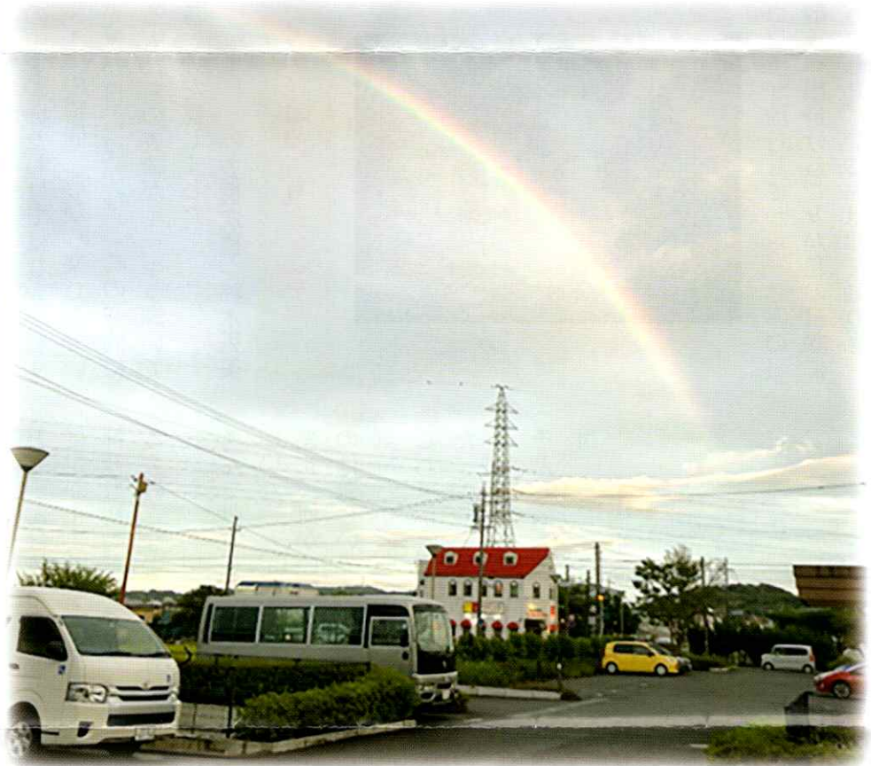
つばさ静岡にかかる二重の虹

どうして今もなお悲惨な戦争が繰り返されるのだろうか。一般市民が巻き込まれて犠牲になるような攻撃をする人も自分たちは正当だと主張する。そこで傷つけられ生活を奪われる小さな命は目に入らない。目を向けようともしない。