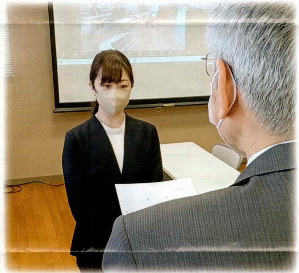
今年度も小羊学園に新たな仲間が加わり辞令が手渡されました *詳しくは4-5Pにて

新年度から適用される障害福祉サービスの報酬改定に合わせた届け出の作成に、各施設・事業所の運営を担っている職員たちは追われている。個別の事情への配慮はないので、国から示されたとおりにするしかない。制度に沿うことができないと、その分は報酬が減額となる。